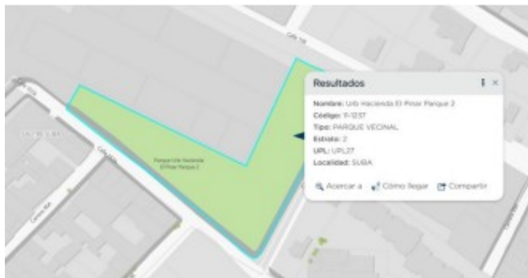
Imagen 1: Localización Parque 11-1237 – 14/04/2026

En atención a la solicitud citada en el asunto, en la que refiere: “(...) CORDIAL SALUDO, COMO RESIDENTE Y USUARIO DEL PARQUE PUBLICO SUBA SALITRE, CÓDIGO 11-1237 ME DIRIJO A USTEDES PARA SOLICITAR INFORMACION OFICIAL SOBRE LA SITUACION DE UNA ACADEMIA DE FUTBOL QUE REALIZA ENTRENAMIENTOS Y PARTIDOS EN LAS ZONAS VERDES DEL PARQUE. ESPECIFICAMENTE, REQUIERO CLARIDAD SOBRE LOS SIGUIENTES PUNTOS: ¿CUENTA ESTA ACADEMIA CON EL PERMISO VIGENTE O CONTRATO DE APROVECHAMIENTO ECONOMICO EMITIDO POR EL IDRD O LA ENTIDAD COMPETENTE PARA REALIZAR ACTIVIDADES DE LUCRO EN ESTE ESPACIO PUBLICO? (...)”. se informa que una vez consultado el inventario de parques del Instituto y el sistema de información geográfica (SIG- IDRD) el predio objeto de la consulta corresponde al parque denominado URBANIZACION HACIENDA EL PINAR PARQUE 2 identificado con el Código IDRD No. 11-1237, de escala de proximidad conforme a lo indicado en el Decreto Distrital 555 de 2021 -POT-; como se observa en la siguiente imagen: